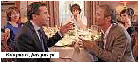
Fais pas ci, fais pas ça

MÉDIAS LES SÉRIES FRANÇAISES QUI VOYAGENT BIEN {page 22}