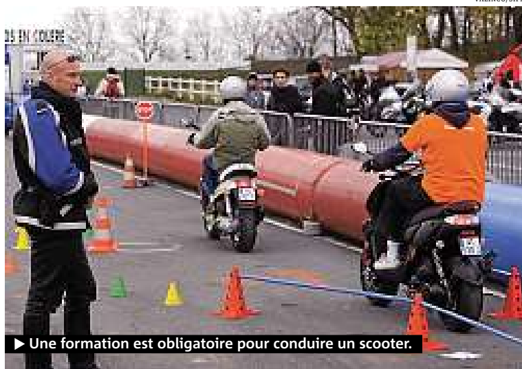
► Une formation est obligatoire pour conduire un scooter.

Un scooter de 50 cm 3 peut être conduit dès 14 ans. Ceux nés après 1988 doivent en plus posséder le BSR (brevet de sécurité routière) à l'issue d'une formation théorique et pratique de cinq heures. Pour un 125 cm 3 , les titulaires du permis B (auto) depuis au moins deux ans doivent suivre une formation de sept heures. Une exception : ceux ayant obtenu le permis B depuis au moins deux ans et pouvant prouver une utilisation de scooter entre les 1 er janvier 2006 et 2011 suivront une formation de trois heures. Enfin, pour une cylindrée supérieure à 125 cm 3 , le permis moto est requis.