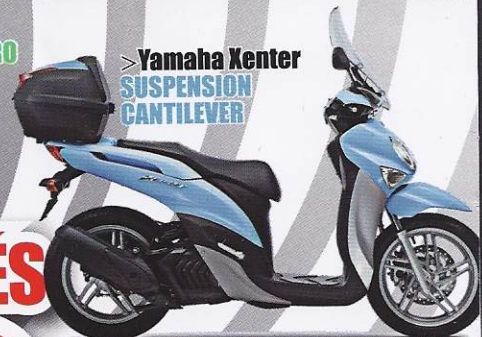
> Yamaha Xenter SUSPENSION CANTILEVER