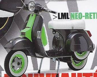
> LML NEO-RETRO