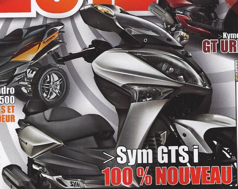
> Sym GTS i 100 % NOUVEAU