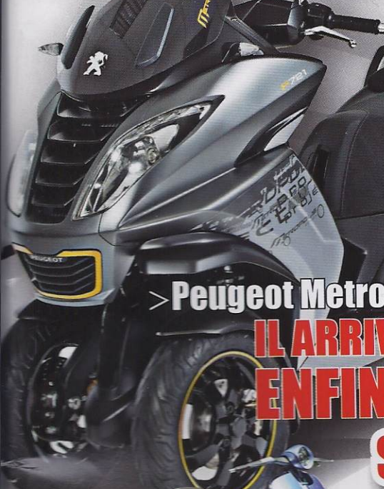
> Peugeot Metropolis 400 IL ARRIVE ENFIN !

+ SUPPLEMENTAIRE GUIDE D'ACHAT SCOOTERS • MOTOS 16 modèles de 1149 à 9995 €