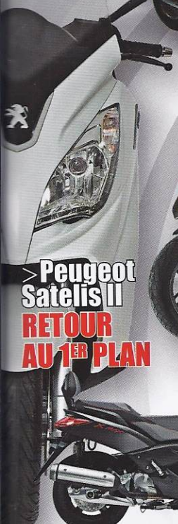
> Peugeot Satelis II RETOUR AU 1 ER PLAN