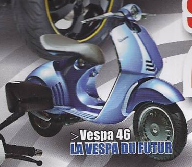
> Vespa 46 LA VESPA DU FUTUR