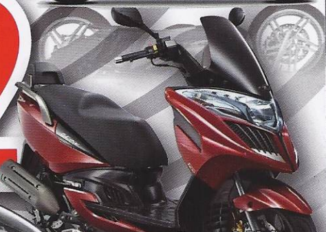
> Kymco G-Dink GT URBAIN