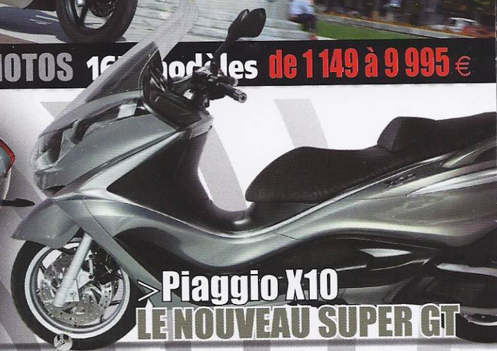
> Piaggio X10 LE NOUVEAU SUPER GT